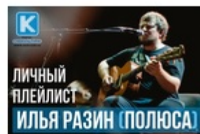
ИЛЬЯ РАЗИН («ПОЛЮСА») – ЛЮБИМЫЕ ПЕСНИ И КЛИПЫ