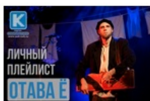
АЛЕКСЕЙ БЕЛКИН («ОТАВА Ё») – ЛЮБИМЫЕ ПЕСНИ Артиста