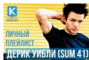
ДЕРИК УИБЛИ (SUM 41) - ЛЮБИМЫЕ ПЕСНИ Артиста

В январе 2016 года портал запустил проект «Личный плейлист», в котором известные актеры, музыканты и деятели шоу-бизнеса делятся с читателями своими любимыми композициями. В проекте уже приняли участие Дерик Уибли (SUM-41), Frank Iero (ex-My Chemical Romance), Евгений Хавтан (Браво), Павел Майков, 25/17, Monatik, Торба-на-Круче, Хелависа (Мельница), СБПЧ, Little Big, Психея, Кравц, Ес Соя, Илья "Чёрт" (Пилот), многие другие.