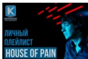
HOUSE OF PAIN – ЛЮБИМЫЕ ПЕСНИ И КЛИПЫ