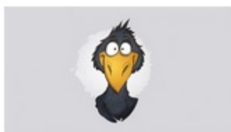
ЛЮБИМЫЕ КНИГИ BIRD BORN